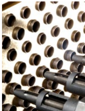
Wymiana rur w chłodnicy silnika i generatora jest jednym z najskuteczniejszych i najłatwiejszych sposobów przywrócenia płynnej pracy wymiennika.

Chłodnice silników i generatorów często mają kontakt z substancjami, takimi jak oleje, sole i kondensaty, które mogą powodować korozję lub erozję żeber, powłok i rur. Zanieczyszczenia dostają się również do otwartych obiegów wody chłodzącej, co prowadzi do gromadzenia się osadów blokujących rury i powodujących wycieki ze złączy i uszczeltek. Nasi eksperci przywracają funkcjonalność za pomocą nowych wkładów oraz przy zastosowaniu najnowszych technologii i materiałów zapewniając optymalną wydajność i niezawodność.